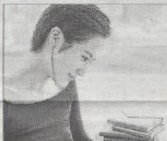
■ La soprano HyeSang Park.

■ Dimanche 26 juin Château du Clos Vougeot 16 heures : dégustation 18 h 30 : Concert dans la chapelle du château avec l'Orchestre épiscopal des Climats de Bourgogne (Mozart, Verdi, Rossini). 20 h 30 : dîner de gala.