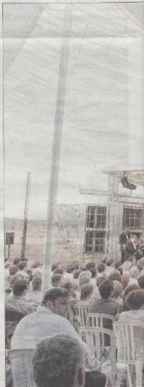
■ Comme chaque année, le festival mus

Cette semaine, qui se présente encore sous les meilleurs auspices, s'achèvera comme de tradition par un dîner de gala au château du Clos Vougeot.