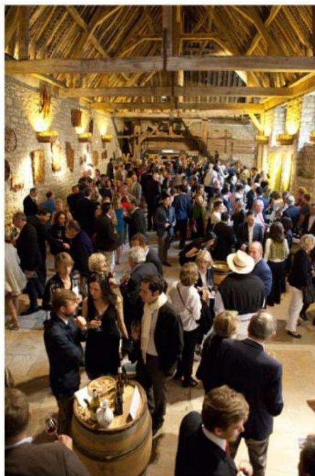
Festival Musique et vin au Clos Vougeot

Nous avons ainsi déplacé le concert dans un endroit