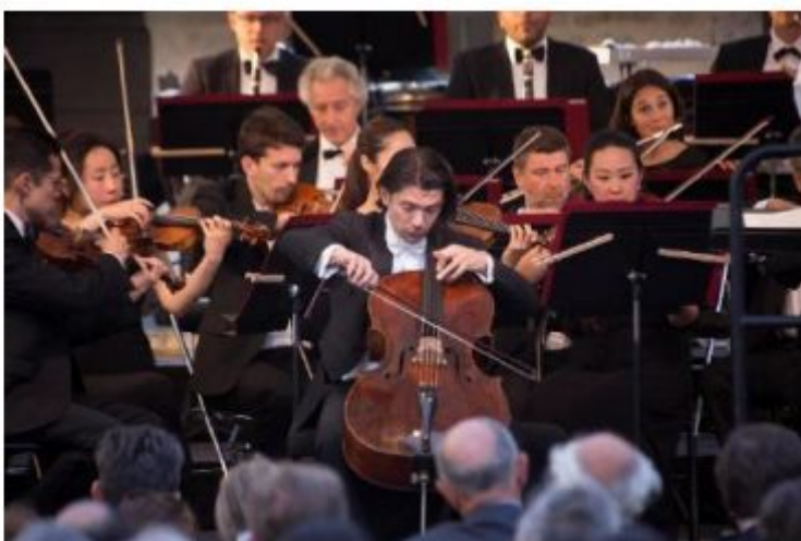
Gautier Capuçon , violoncelliste