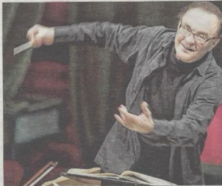
■ Charles Dutoit dirigera l'Orchestre éphémère des Climats de Bourgogne. Photo

Le dernier dimanche de juin, Charles Dutoit dirigera dans la cour du château du Clos Vougeot l'Orchestre éphémère des Climats de Bourgogne avec un casting de solistes exceptionnels : le baryton basse Ildar Abdrazakov, la soprano Hyesang Park et le violoncelliste Gautier Capuçon. Au programme de la soirée, Rossini, Mozart, Verdi ou encore Bizet.