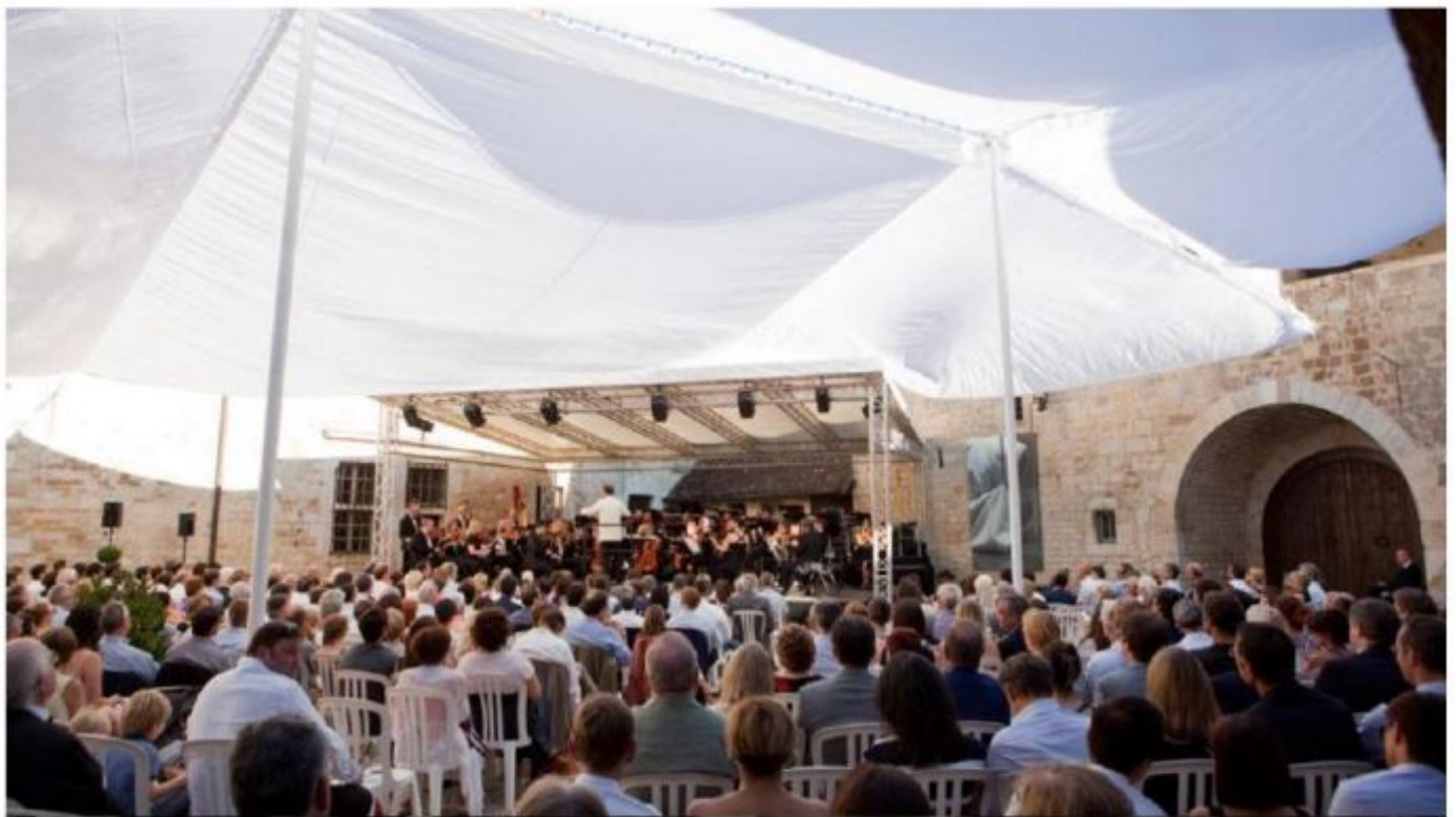
Festival Musique et vin au Clos Vougeot