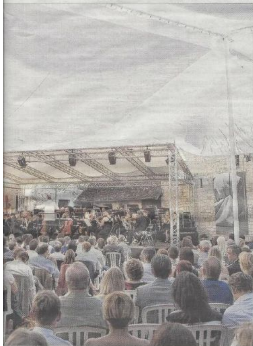
Le festival au Clos Vougeot sera le rendez-vous de l'excellence.