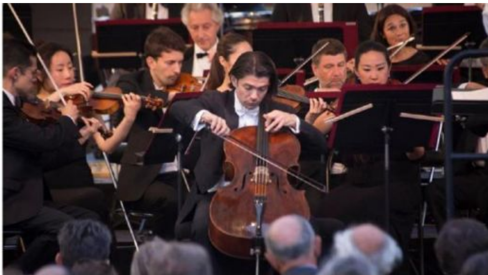
Au festival on retrouve les solistes du MET et les jeunes talents, mais également des grands noms comme les frères Capuçon et Michel Dalberto. Comment choisissez-vous les artistes ?